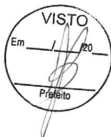
Leandro Signor Assuntos Estratégicos Município de Coronel Vivida - PR