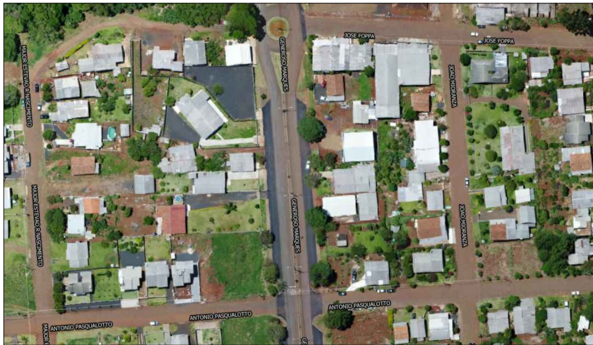
Imagem de Satélite