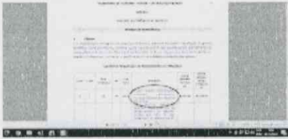
Termo Referencia PE 88.jpg 155K