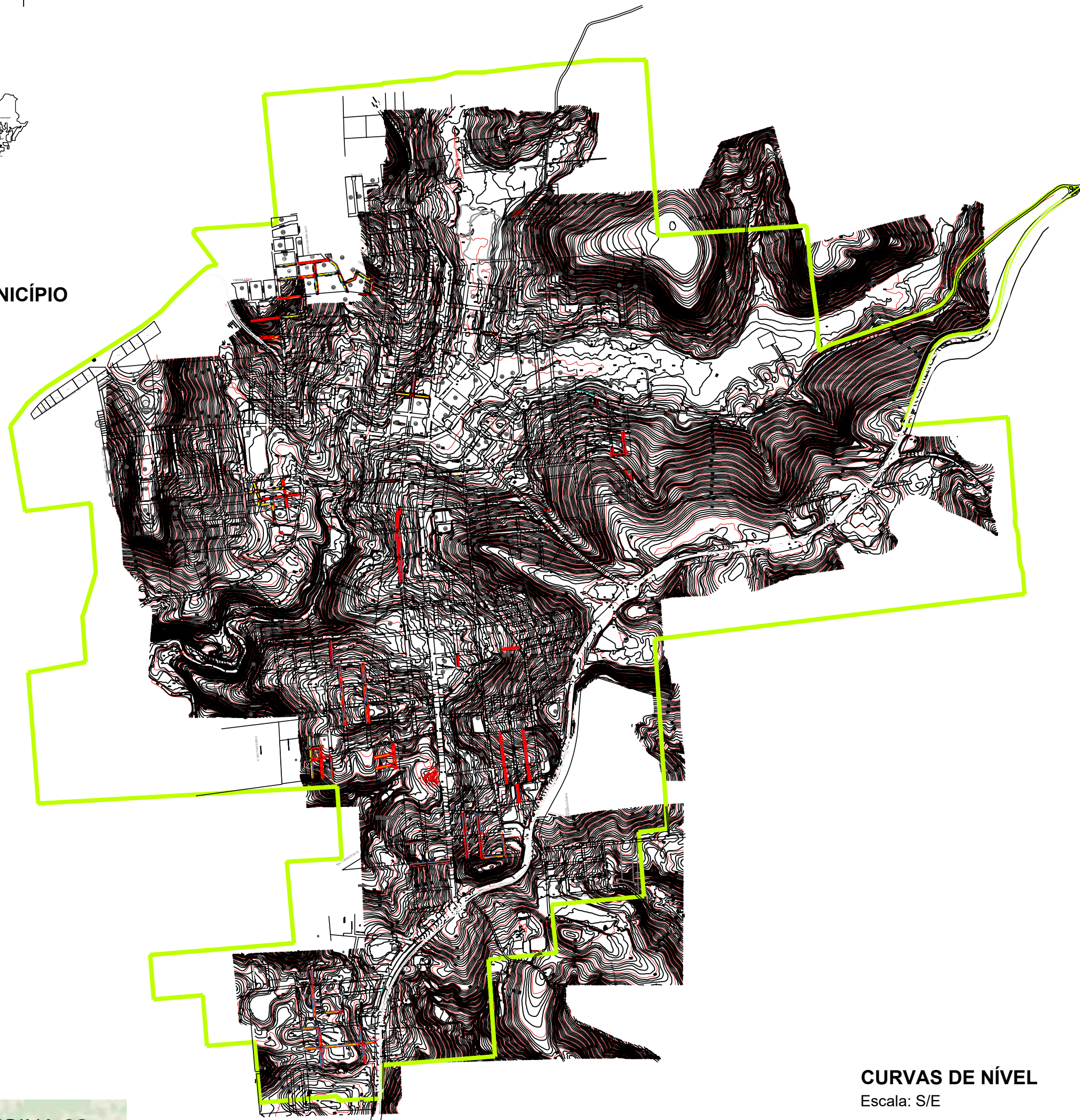
CURVAS DE NÍVEL Escala: S/E