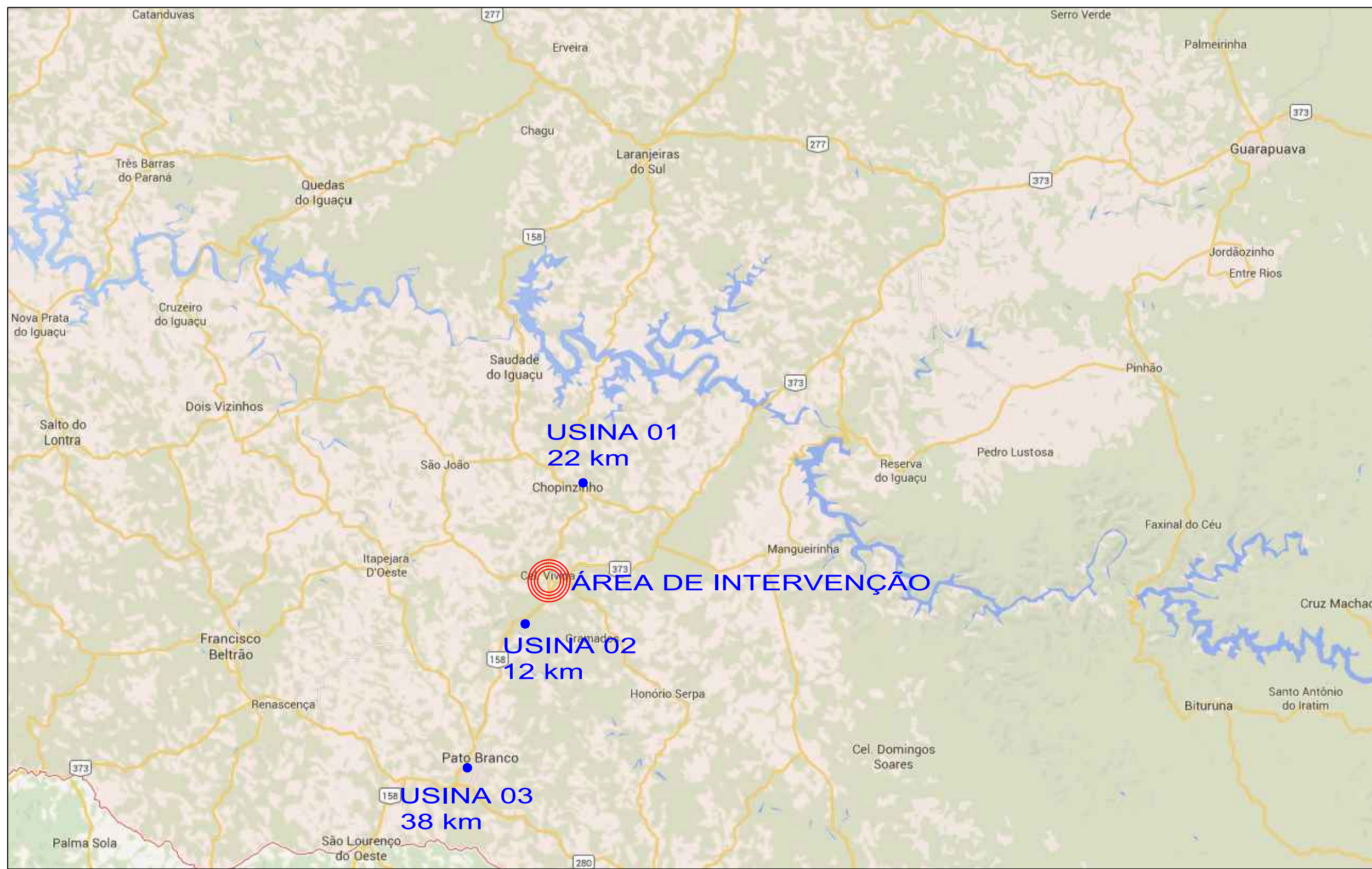
CROQUI DMT - DISTÂNCIA MÉDIA DE TRANSPORTE Escala: S/E