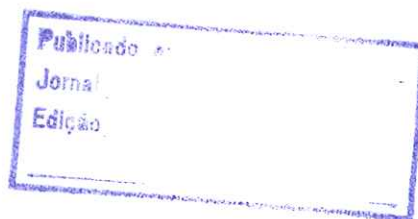
Valdir Picoletto Prefeito Municipal

Gabinete do Prefeito Municipal de Vitorino, em 05 de junho de 2011.