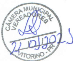
Marciano Vottri Prefeito Municipal

Gabinete do Prefeito Municipal de Vitorino, em 18 de janeiro de 2021.